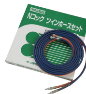
Nコック ツインホースセット