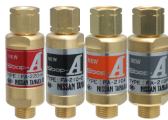
逆火防止器 NEW Stop-A 水素用・酸素用・アセチレン用・プロパン用