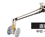
直線誘導輪 中切・A切にも適合