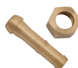
W20-16袋ナット & φ12ホース口