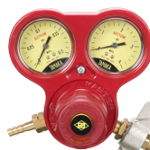
マスターVI A 工業用アセチレン調整器の定番 安心設計の調整器