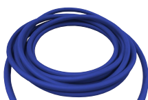
酸素用太径ホース (内径φ12)