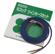
Nコック ツインホースセット