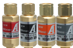
逆火防止器 NEW Stop-A