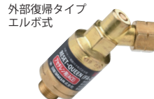
逆火防止器 リセットクイーン 酸素用・アセチレン用・LPG、エチレン、メタン(天然ガス)用

※ NコックJackは00号溶接器、小形溶接器、中形溶接器にご使用いただけます ※ 00号溶接器でお使いの際は変換ホースが必要となります