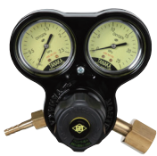
マスターVI OG 工業用酸素調整器の定番 関東式OG・関西式OF