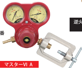
マスターVI A 工業用アセチレン調整器の定番 安心設計の調整器