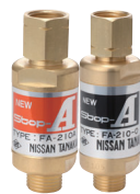
逆火防止器 NEW Stop-A アセチレン用・酸素用