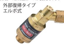
逆火防止器 リセットクイーン 酸素用・アセチレン用・LPG、エチレン、メタン(天然ガス)用

※ NロックJackは00号溶接器、小形溶接器、中形溶接器にご使用いただけます ※ 00号溶接器でお使いの際は変換ホースが必要となります