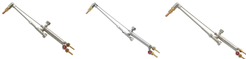
中形切断器Zノバック