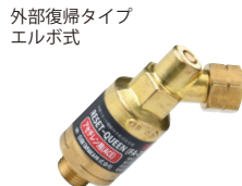
逆火防止器 リセットキー