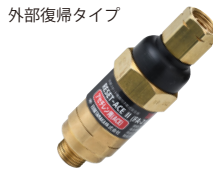
逆火防止器 リセットエースII