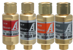
逆火防止器 NEW Stop-A