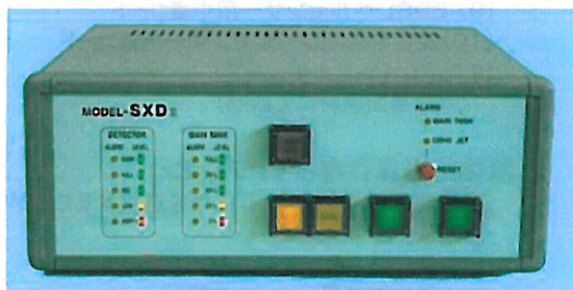
MODEL-SXD II Controller

液体窒素自動供給装置MODEL-SXD IIは、エネルギー分散型X線分析装置(その他マルチチャンネルアナライザー、非分散型X線分析装置等)の半導体検出器を冷却するために必要な液体窒素の自動供給をより安全に行なう事を目的として開発された製品です。分解能を保持する上で常に低温下におかなければならない半導体検出器を保護するため、冷却用液体窒素容器内の液体窒素レベルを直接検知し、常に安全な範囲に保持します。