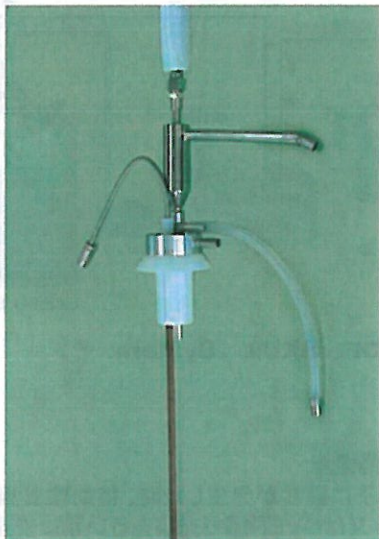
供給蓋及び気液分離機器 EDS用レベルセンサー