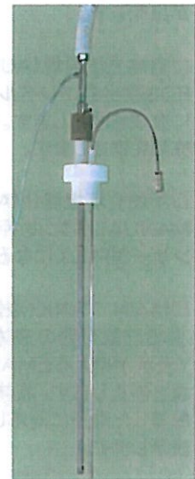
クライオジェット レベルセンサー 容器アダプター